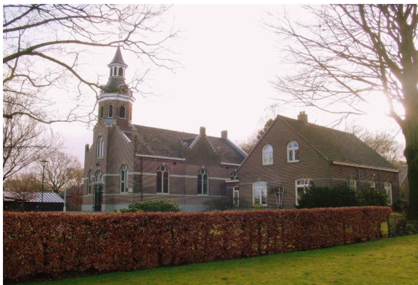
Kerk en pastorie Okkenbroek